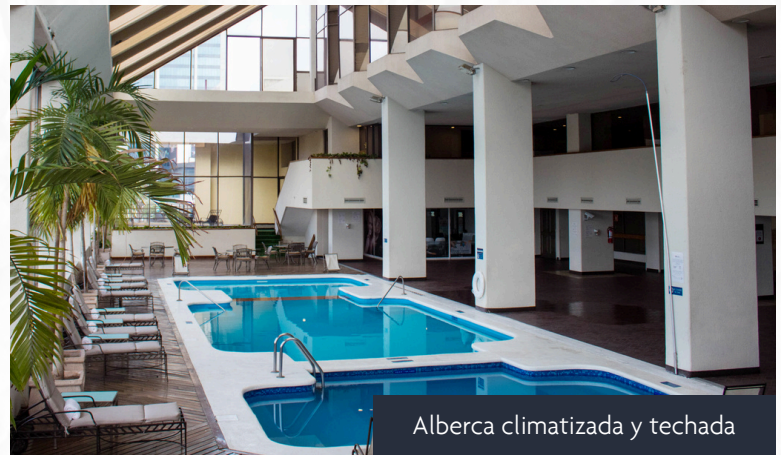
Alberca climatizada y techada