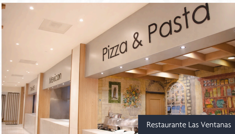
Restaurante Las Ventanas